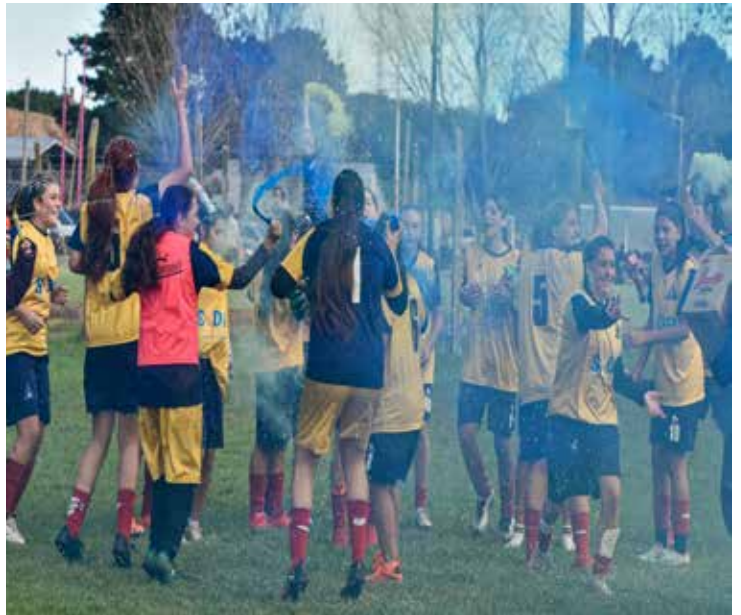
Las chicas de Atlético celebran en Pinamar.