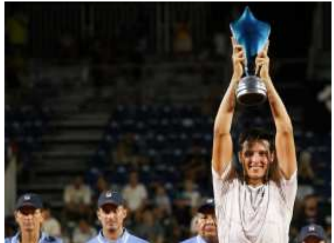
Tras un excelente 2024, Darderi busca subir la vara en Australia.-

Tendrá en este Grand Slam, que ya comenzó con los partidos de Qualy pero que tendrá a Darderi jugando luego del fin de semana, una gran motivación para dar el golpe.